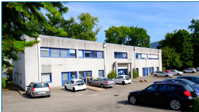
Le bâtiment actuel loué partiellement par l'AEHS

« C'est l'histoire d'une école où les enfants aiment comprendre, apprendre, grandir... ils partagent leur sourire et leur joie de vivre... »