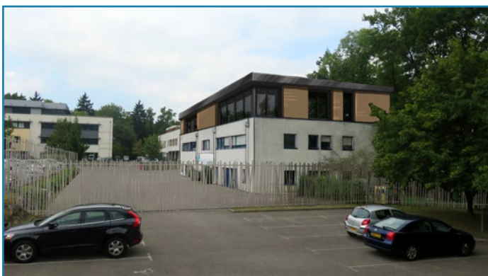
Le projet avec l'agrandissement futur

L'École Sainte-Cécile et le Collège Sainte-Philomène ne reçoivent ni subvention des collectivités, ni aide de l'État. Les seules ressources disponibles sont issues de généreux donateurs privés et des parents d'élèves. Grâce à votre soutien, de nombreux enfants pourront apprendre et grandir dans un cadre épanouissant, au cœur de l'agglomération d'Annecy !