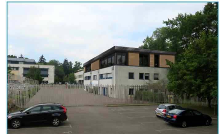
Le projet avec l'agrandissement futur