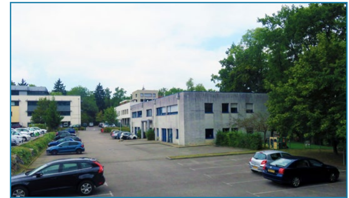
Le bâtiment actuel loué partiellement par l'AEHS